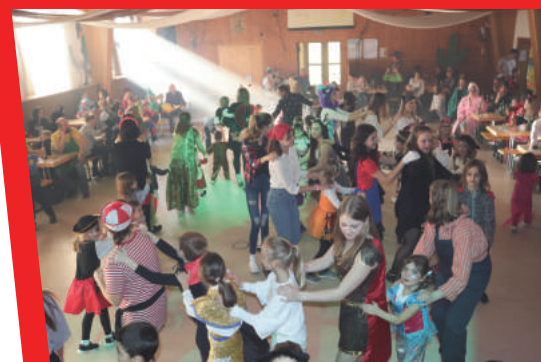
Kinderfasching der Turnverein Jugend in der alten Halle am rußigen Freitag.