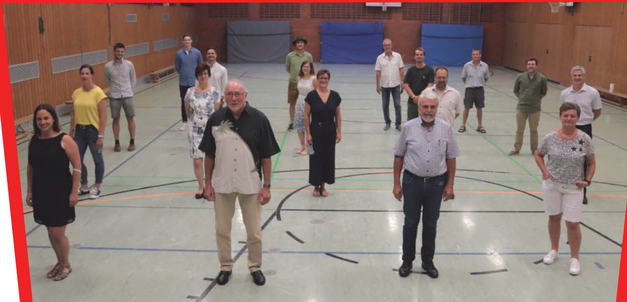
Die aktuelle Vorstandschaft vom Turnverein Prittriching.