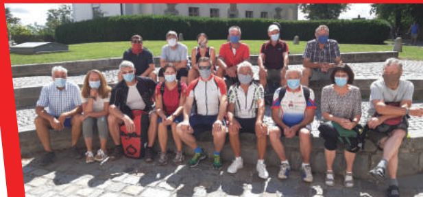
Radwallfahrt nach Andechs an Mariä Himmelfahrt.

Das Internationale Deutsche Turnfest 2021 in Leipzig wird nicht stattfinden – Stopp – die Absage der Großveranstaltung erfolgte vor wenigen Wochen – Stopp – die Radwallfahrt nach Andechs war wieder ein voller Erfolg – Stopp – ob per Rennrad, normalem Rad oder mit dem E-Bike, die 15 Radler hatten sich das Motto des Tages: „ein Weg, ein Ziel, eine Gruppe“ verinnerlicht – Stopp – voll Zuversicht blicken unsere LeistungsturnerInnen wie Wettkampfgruppen auf 2021 – Stopp – sehnsüchtig warten sie auf den überregionalen Vergleich mit anderen Teams – Stopp – eine Gruppe des TVP hat äußerst erfolgreich beim Landsberger Stadtradeln mitgemacht – Stopp – mit über 8500 geradelten Kilometern gehörten sie zu den TOP Teams aus dem Landkreis – Stopp –