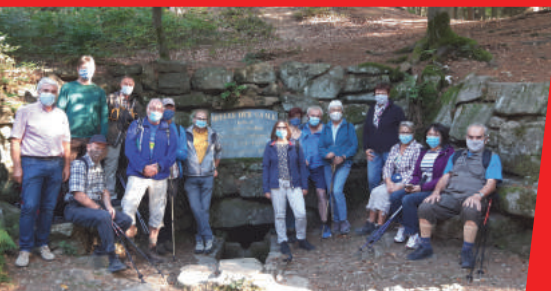
Die TVP-Wanderfreunde im Fichtelgebirge.